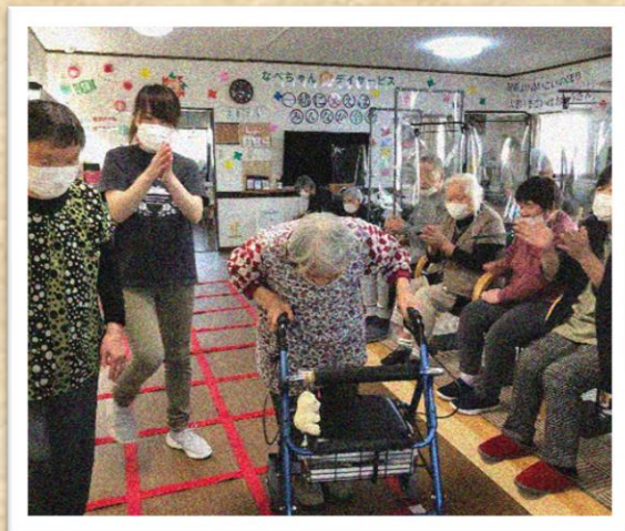
「ふまねっと」の様子