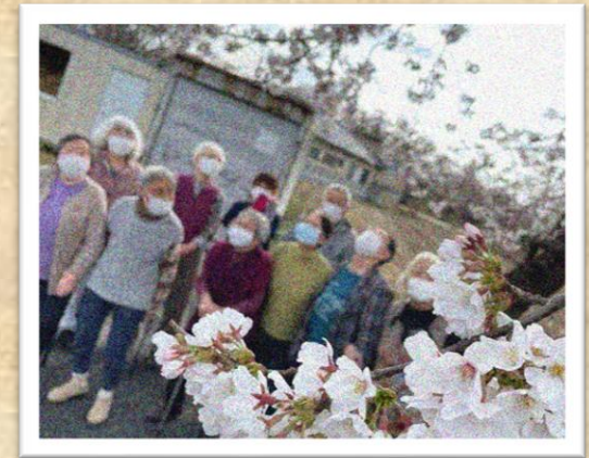
お出かけの一例（お花見）

※1 MMSE…認知症検査 ※2 FAB…前頭葉機能検査 ※3 2001年 産官学の共同研究「脳機能検査に見る学習療法の効果」より